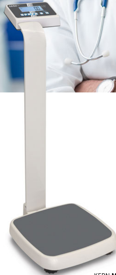
KERN MPE-P με κολώνα